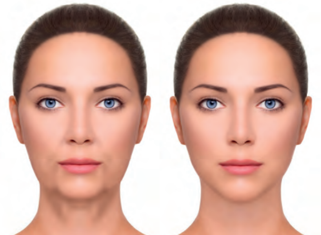
Das Vorher und Nachher eines Faceliftings.

Oft bietet sich auch die Kombination mit einer Halsstraffung an. Zum Beispiel kann ein Facelift auch am Hals noch effektiver wirken, indem man bei der Operation einen oberflächlichen Hautmuskel (Platysma-Muskel) etwas schwächt und damit den Zug auf das Gesicht verringert. Bei zusätzlich starken Alterszeichen im oberen Bereich des Gesichts lässt sich ein Facelift beispielsweise auch wunderbar durch ein Stirnlifting ergänzen. Es ist Aufgabe des Chirurgen, das passende Behandlungskonzept und die ideale